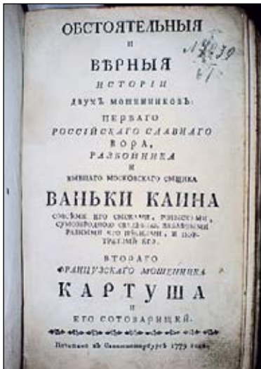
Титульный лист первого издания авантюрного романа М. Комарова «Обстоятельные и верные истории... Ваньки Каина...» (1779).

«Пригожая повариха, или Похождения развратной женщины». Как и все «шедевры» подобного рода, он сделан на потребу публике, в основном купеческой.