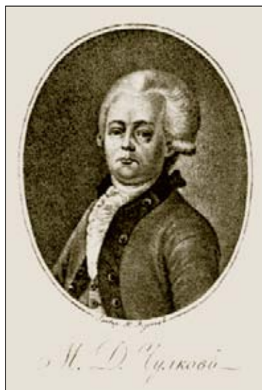
Михаил Дмитриевич Чулков (1743—1793) прославился не только как прозаик, сочинитель первого плутовского романа «Пригожая повариха, или Похождения развратной женщины», но и как журналист, издатель сатирических журналов «И то и сё», «Парнасский щепетильник», составитель «Словаря русских суеверий» (1782; переиздан в 1786 году под названием «Абевага русских суеверий»), этнографического «Собрания разных песен», семитомного «Исторического описания российской коммерции» и многих других произведений.