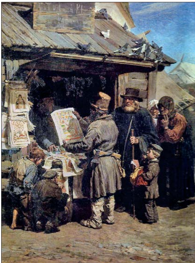
В. М. Васнецов. «Книжная лавочка». 1876 год.

И всё же первым детективом можно считать полузабытый рассказ с неприятным названием «Горькая участь».