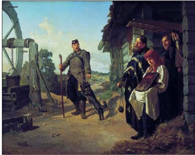
Н. В. Неврев. «Возвращение солдата на родину». 1869 год.

«...сие действие, — продолжает Чулков, — происходит в бывших провинциальных канцеляриях». Провинциальные канцелярии, осуществлявшие общее управление и суд на территории провинциального города и его уезда, были созданы при Петре I в ходе провинциальной реформы 1719 года в